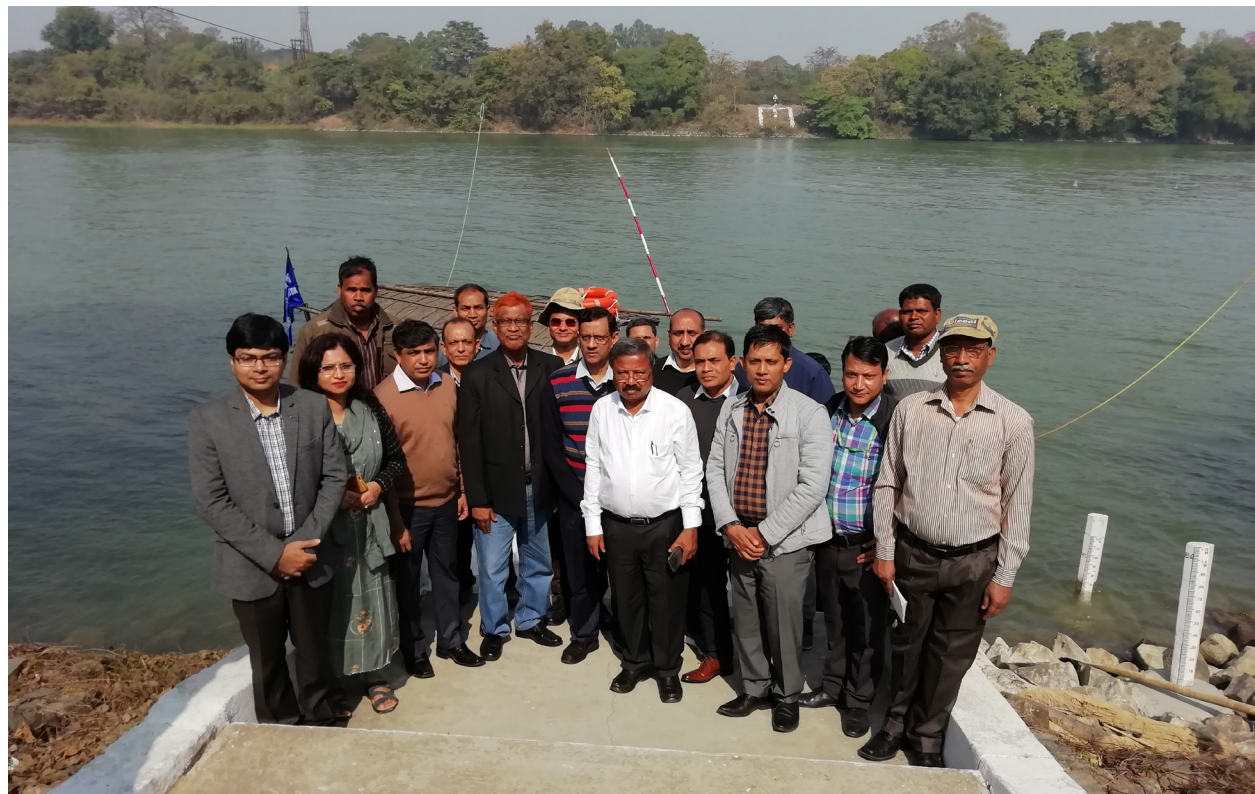
১৪ ফেব্রুয়ারি, ২০১৯ তারিখে ভারত-বাংলাদেশ যৌথ কমিটির প্রতিনিধিদল কর্তৃক ৭১তম বৈঠকের পূর্বে ভারতের ফারাক্কা ব্যারেজের ফিডার ক্যানালের প্রবাহ পরিমাপ সাইট পরিদর্শন।