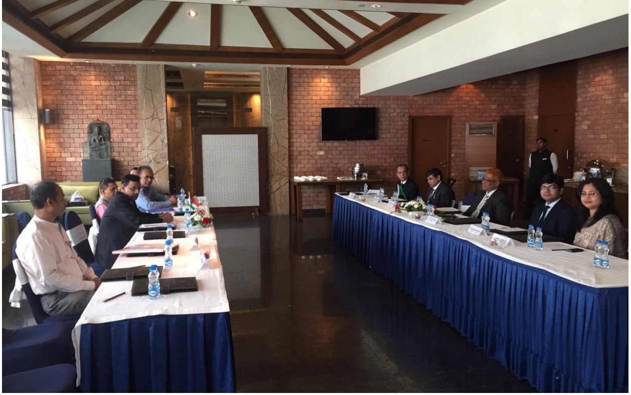
১৫ ফেব্রুয়ারি, ২০১৯ তারিখে কোলকাতায় অনুষ্ঠিত ভারত-বাংলাদেশ যৌথ কমিটির ৭১তম বৈঠক।