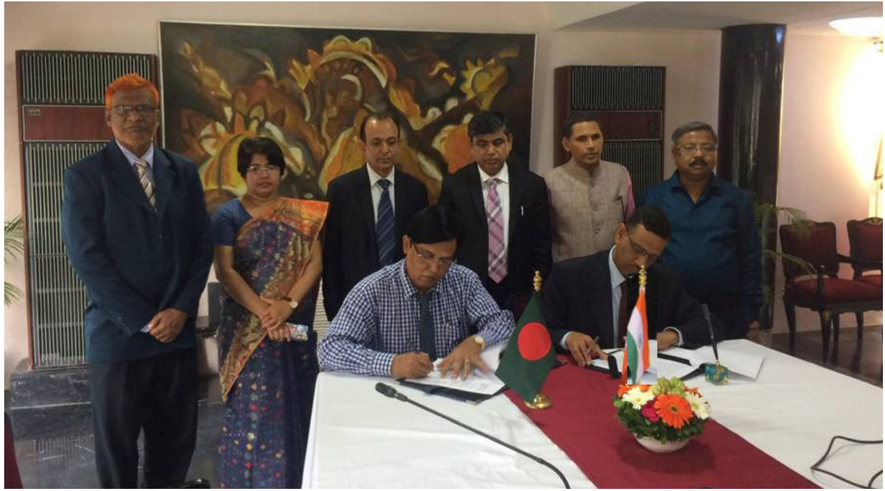
২৯ এপ্রিল, ২০১৯ তারিখে অনুষ্ঠিত ভারত-বাংলাদেশ যৌথ কমিটির ৭২তম বৈঠক শেষে বৈঠকের সম্মত কার্যবিবরণী স্বাক্ষর।