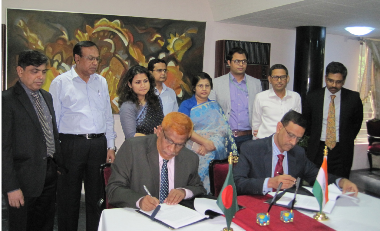
১০ সেপ্টেম্বর, ২০১৮ তারিখে ঢাকায় অনুষ্ঠিত ভারত-বাংলাদেশ যৌথ কমিটির ৭০তম বৈঠকে গঙ্গা নদীর পানি বণ্টন সংক্রান্ত ২০১৮ সালের বার্ষিক প্রতিবেদন স্বাক্ষর।